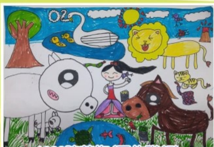
1328 陳燕梅 (圓的聯想)