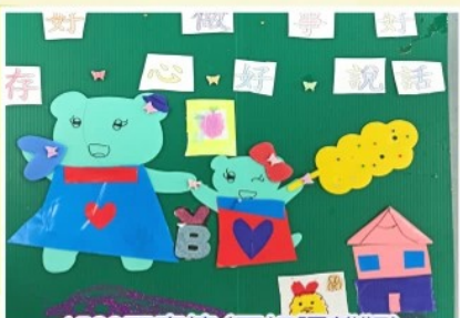
1523 王宣捷 (三好隔離版)