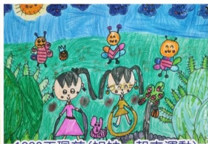
1228 王珮慈 (姐妹一起來運動)