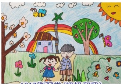
1217 劉羽棠 (奶奶和我)