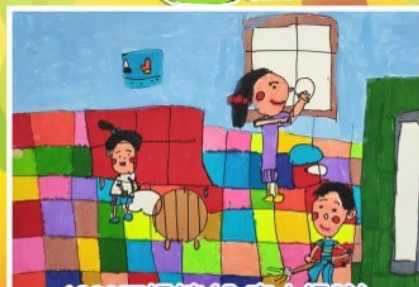
1220 王婉婷 (全家大掃除)