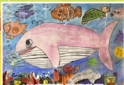
1223 陳妍安 (海底世界)