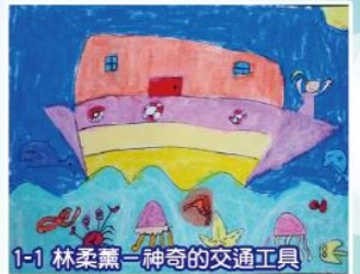
1-1 林柔蕪—神奇的交通工具