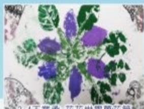
2-4王業承-花花世界萬花筒